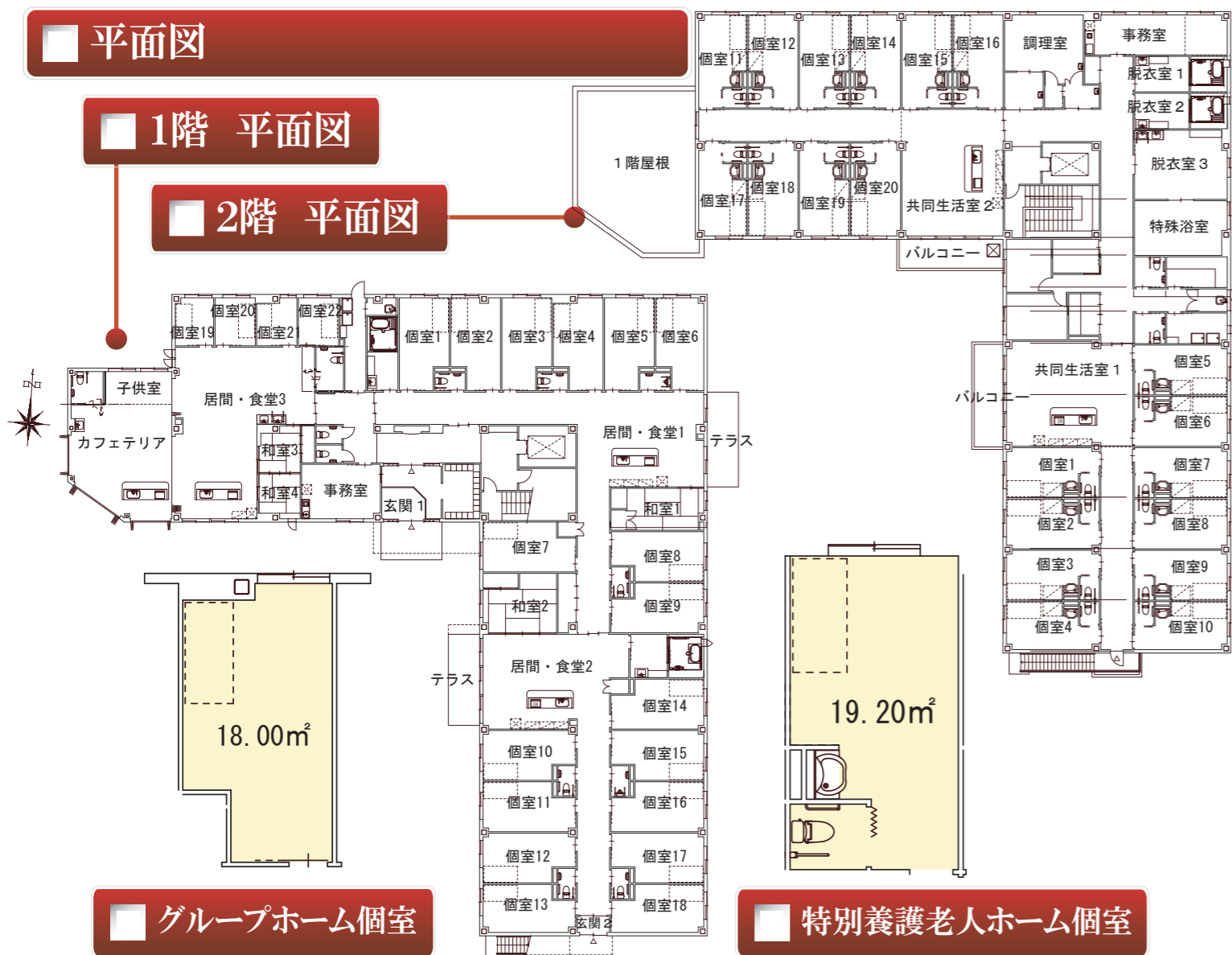
■ グループホーム個室