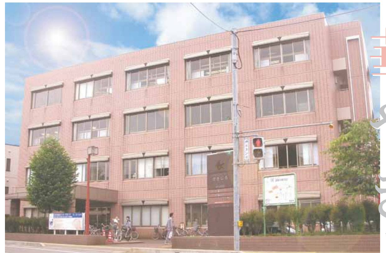
長岡市高齢者センターけさじろ