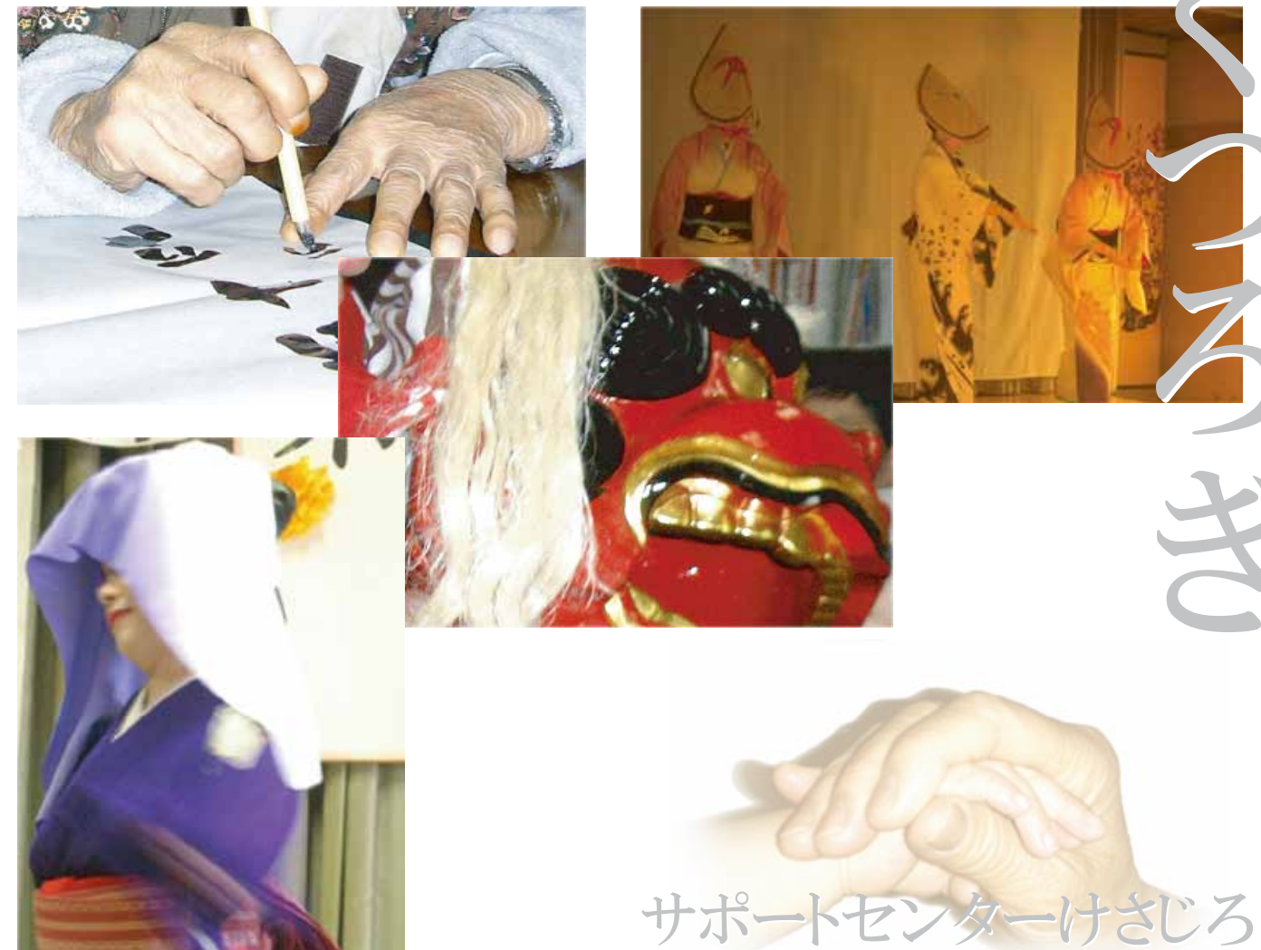
サポートセンターけさじろ

〒940-0033 新潟県長岡市今朝白2丁目8番18号 長岡市高齢者センターけさじろ TEL 0258-39-6266 FAX 0258-39-6299 各種介護相談やお問合せなど、お気軽にお電話ください。