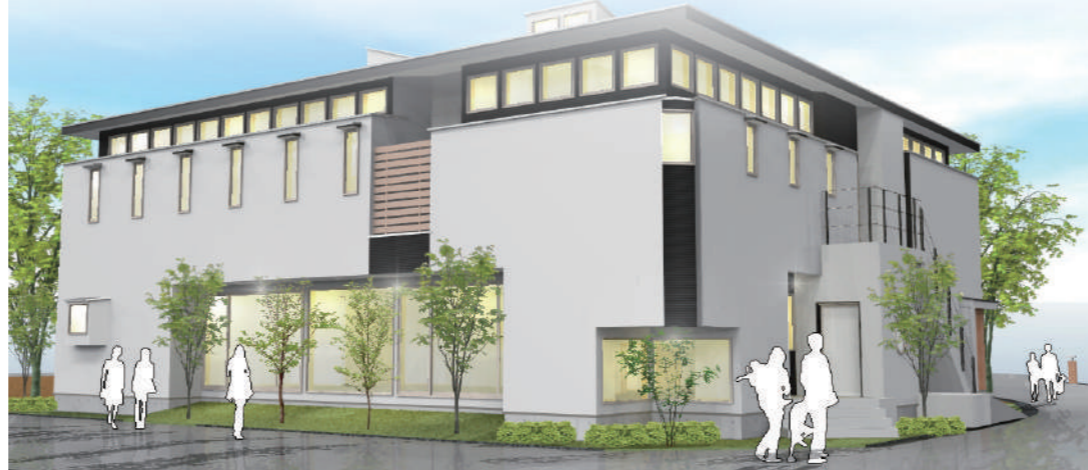
※建物2階部分は在宅支援型住宅となっております。(10室)

専任職員を24時間配置し、利用者さんの皆さんの生活支援に従事致しますし、できる限りの自立支援を尊重致します。