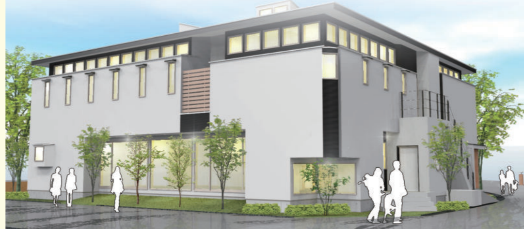
※建物1階部分は認知症対応型共同生活介護となっております。

在宅支援型住宅とは、バリアフリー環境(車イス対応)の居住を提供するもので、認知症対応型共同生活介護(グループホーム)が1階部分に併設されています。また小規模多機能型居宅介護事業所が隣接しており、住み慣れた地域での皆様の生活をサポートいたします。