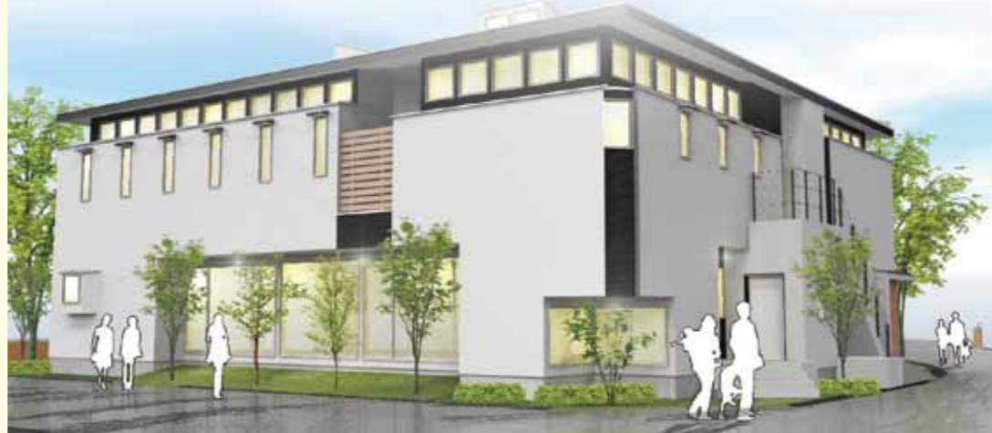
※建物1階部分は認知症対応型共同生活介護となっております。

在宅支援型住宅とは、バリアフリー環境(車イス対応)の居住を提供するもので、認知症対応型共同生活介護(グループホーム)が1階部分に併設されています。また小規模多機能型居宅介護事業所が隣接しており、住み慣れた地域での皆様の生活をサポートいたします。